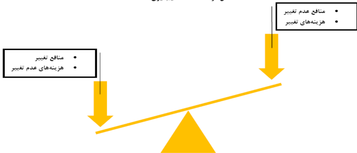
شکل دو الاکلنگ تصمیم‌گیری

یک راه دیگر تشویق بیمار در نظر گرفتن هزینه‌ها و منافع مصرف فعلی مواد، کمک به آنها برای ترسیم جدول مشابه جدول صفحه بعد است. این جدول می‌تواند هنگام درخواست از بیمار برای صحبت درباره جنبه‌های خوب و نه چندان خوب مصرف مواد کمک کننده باشد.